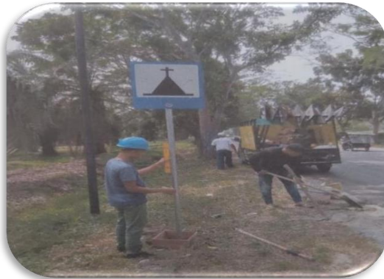
Gambar III. 7 Rehabilitasi/pemeliharaan Perlengkapan Jalan