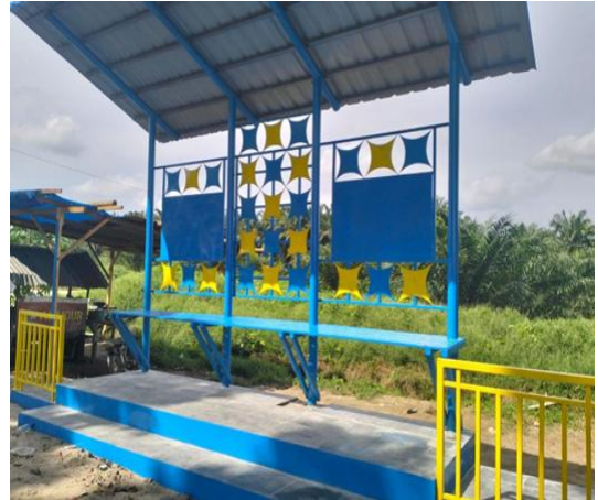
Gambar III. 4 Pembangunan Halte dan Portal