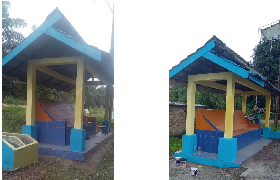
Gambar III. 6 Rehabilitasi/pemeliharaan Prasarana Jalan