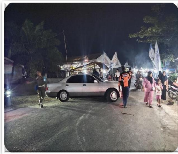
Gambar III. 2 Pelaksanaan Pengaturan dan Pengamanan Hari Besar