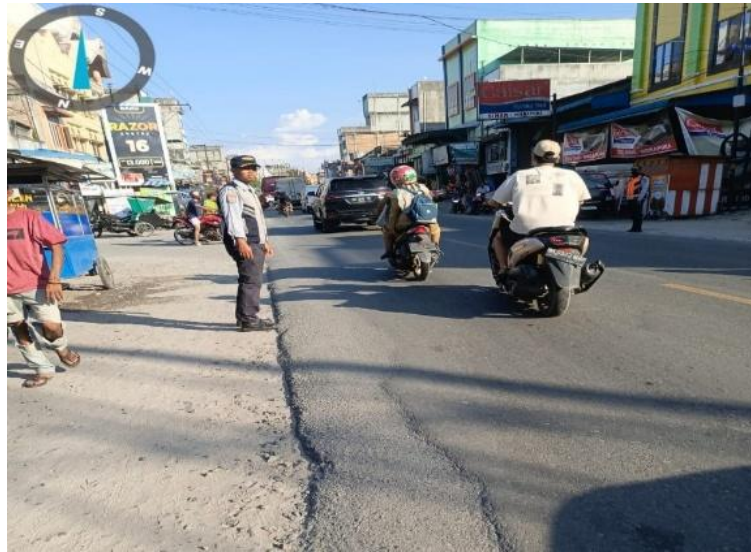
Gambar III. 3 Pelaksanaan Pengaturan Lalu Lintas

Capaian indikator Persentase Konektivitas Darat yang mencapai 100% menunjukkan bahwa pelaksanaan program telah berjalan sesuai dengan target yang ditetapkan dalam dokumen perencanaan. Hal ini mencerminkan efektivitas pelaksanaan kegiatan pada ruas-ruas jalan strategis dalam mendukung keterhubungan antarwilayah di Kabupaten Batu Bara.