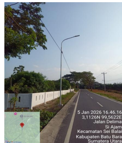
Gambar III. 5 Penyediaan Rambu – rambu lalu lintas, LPJU dan Lampu Sorot