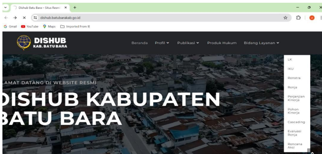
Gambar III. 9 Tampilan Web Dinas Perhubungan