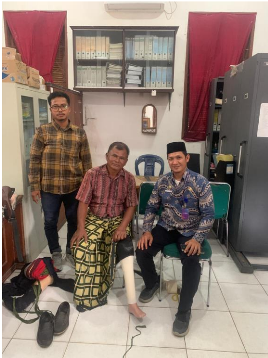
Penyerahan Kaki Palsu