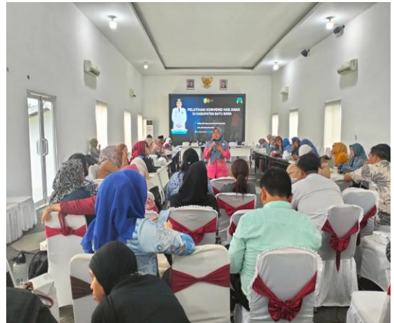
Kegiatan Pelatihan Forum Anak Kabupaten Batu Bara