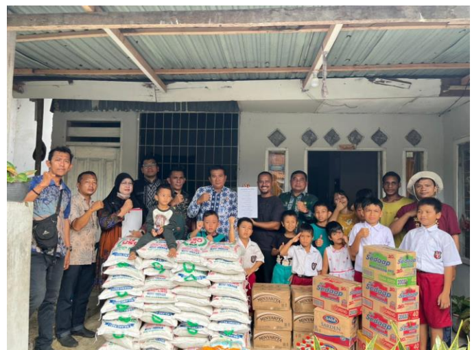
Penyerahan Bantuan Logistik Kepada LKS