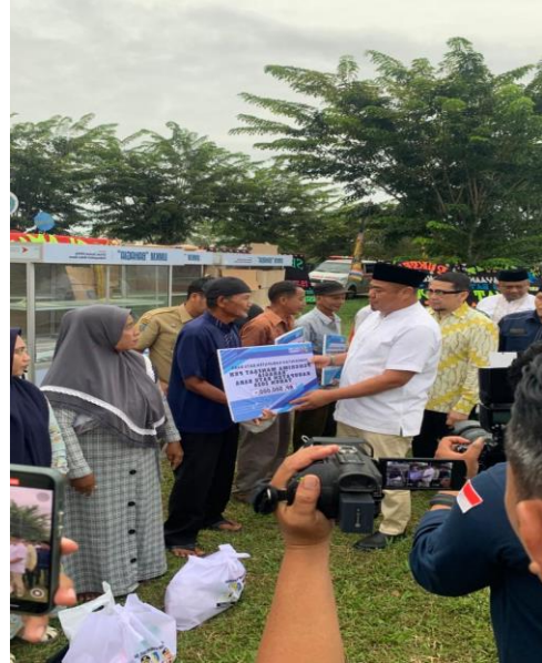
Bupati dan Wakil Bupati Kabupaten Batu Bara Menyerahkan Bantuan “PKH Bahagia” secara simbolis kepada Masyarakat Batu Bara