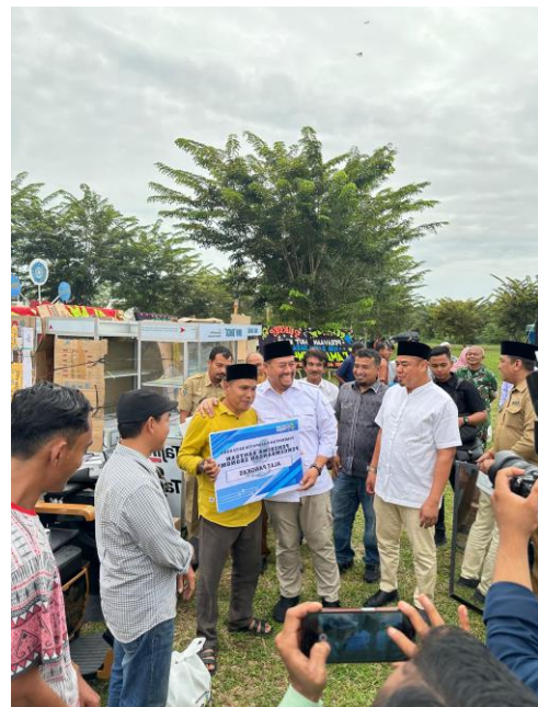
Pemberian Bantuan Usaha Ekonomi Produktif Kepada 84 KPM Masyarakat Kabupaten Batu Bara